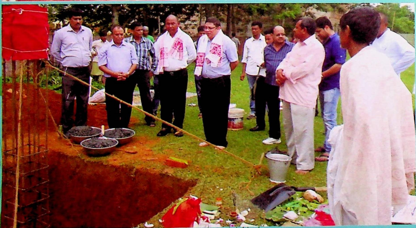
D.C & Local M.A.L. at a Foundation stone laying ceremony