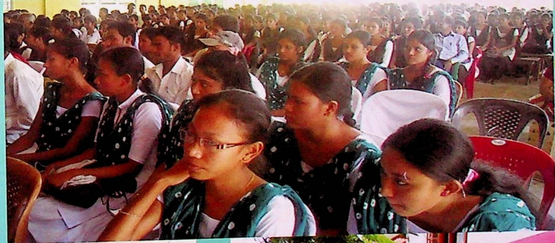
P.G. Students' at a Function